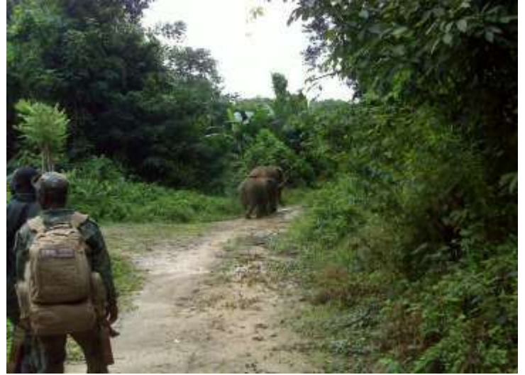
Suivi des éléphants entre les villages gbéy kawin et Tiapa dans Senniquelly (11/09 /2020)