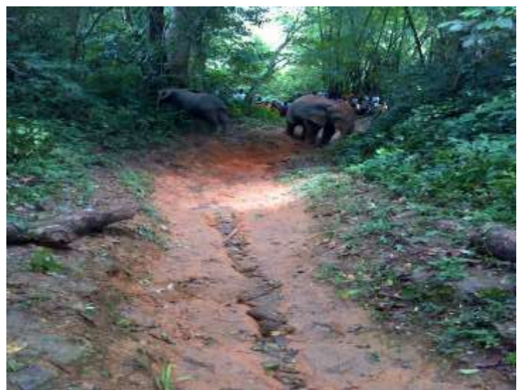
Suivi des Eléphants dans le village Zuouplay(13/09 :2020)