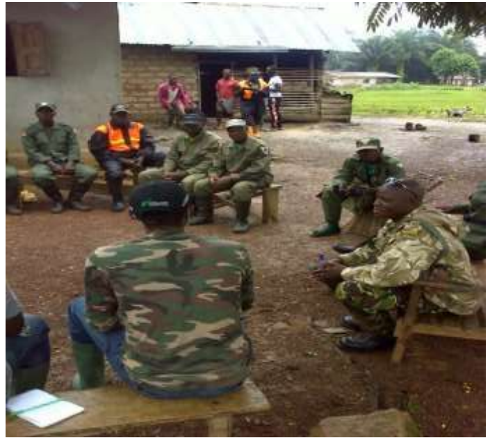
Prise de contact avec les agents de FDA à Gbéy-lèpoula (09 /09/2020)