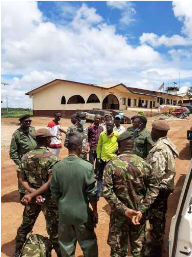
Réception de la mission par le responsable de