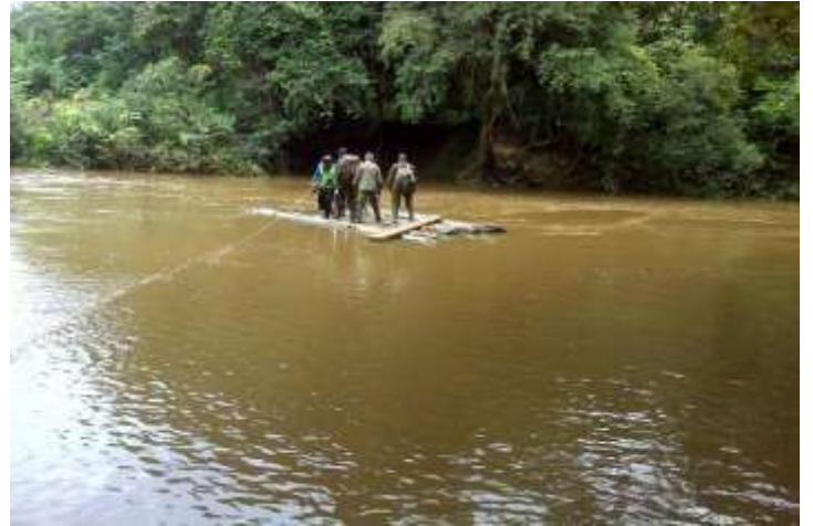
Traversée du fleuve Yaâ entre les villages Tiapa et Péy (Senniquelly et Ghanta) le 12 /09/2020