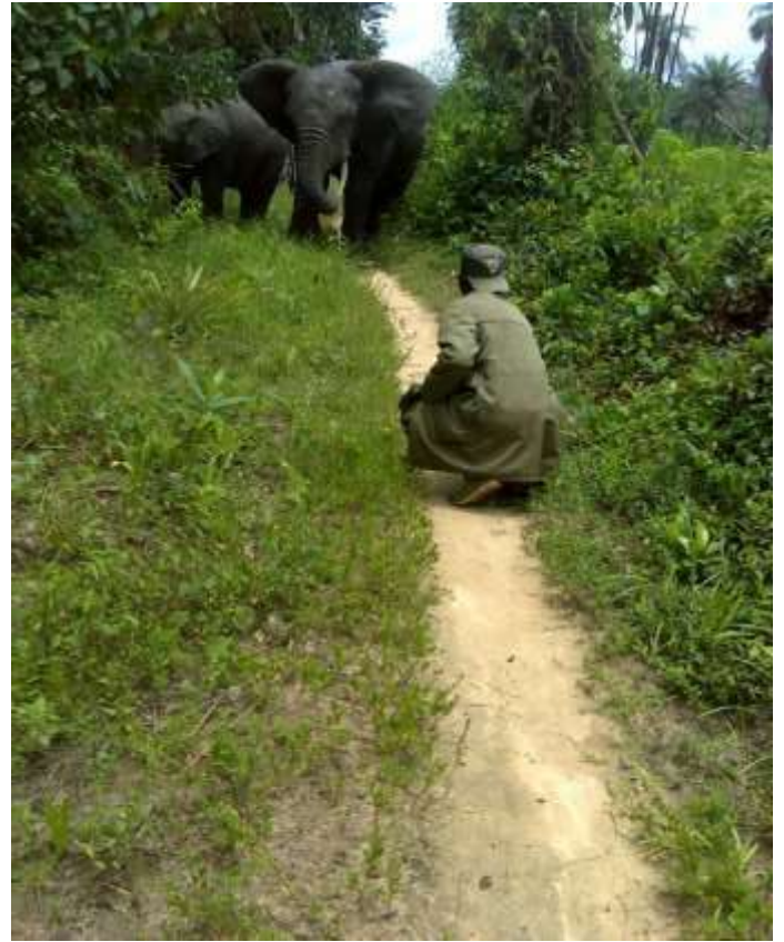
Suivi éléphants entre les villages péy et Zuouplay dans Ghanta (14 /09/2020)