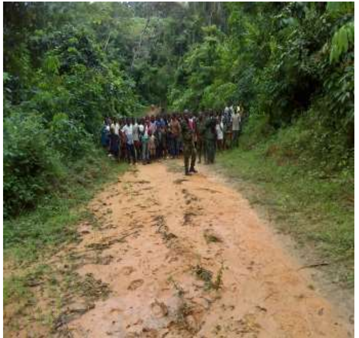
Suivi des éléphants entre les villages Gbéy lèpoula et gbéy kawin dans Sennielly (10/09/2020)