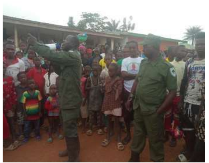
Séance de Sensibilisation sur les précautions et comportement à adopter pour la protection des Eléphants dans les villages Zuouplay et Pey (15/09/2020)