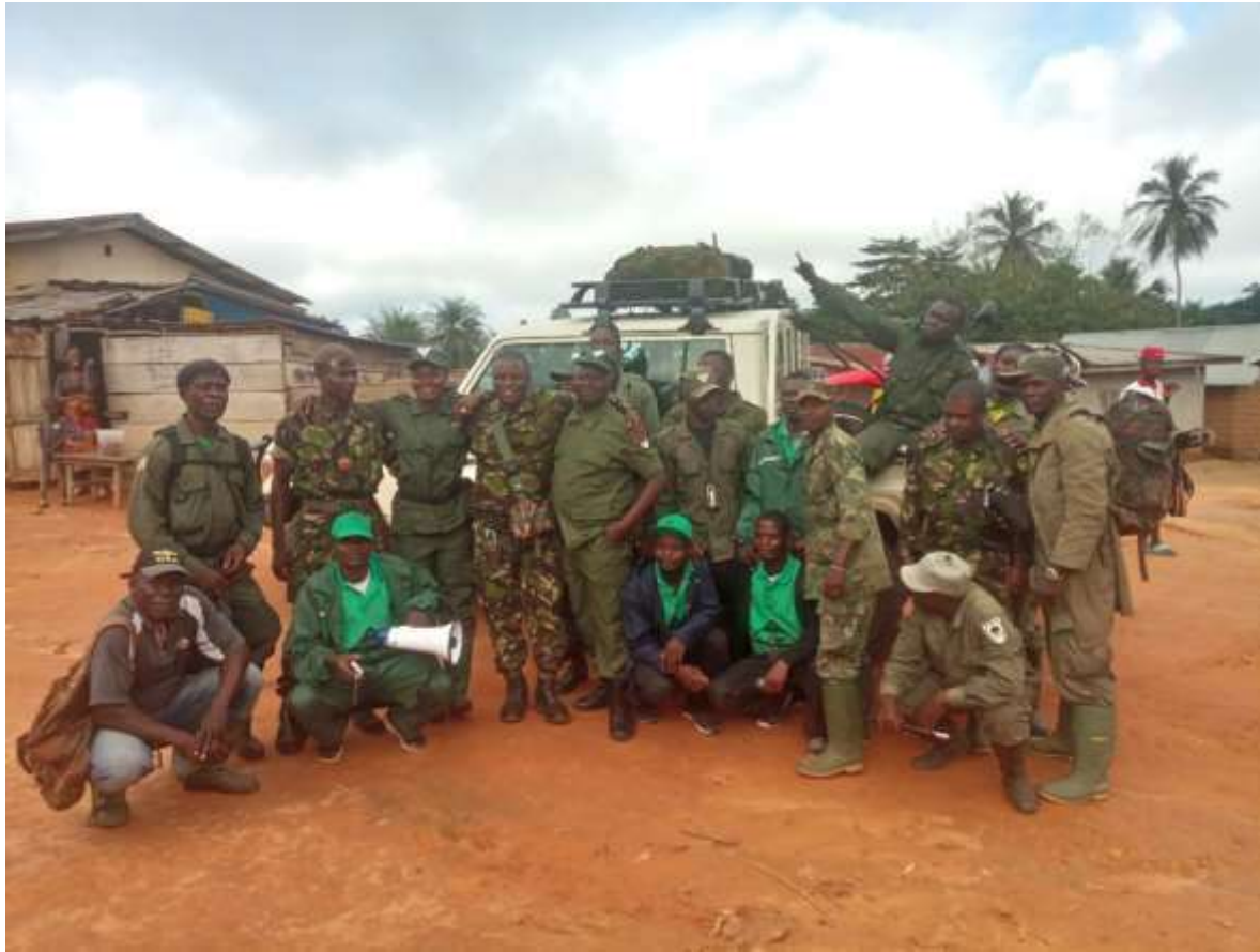
Photo de famille des conservateurs Guinéen et FDA Libéria