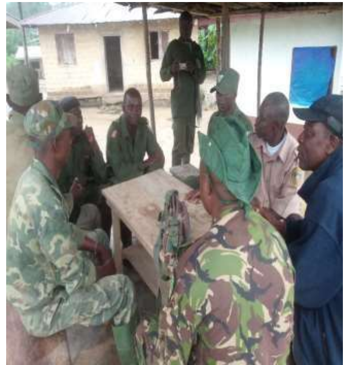
Séance de formation théorique des agents de FDA Libéria par la mission (18/09/2020)