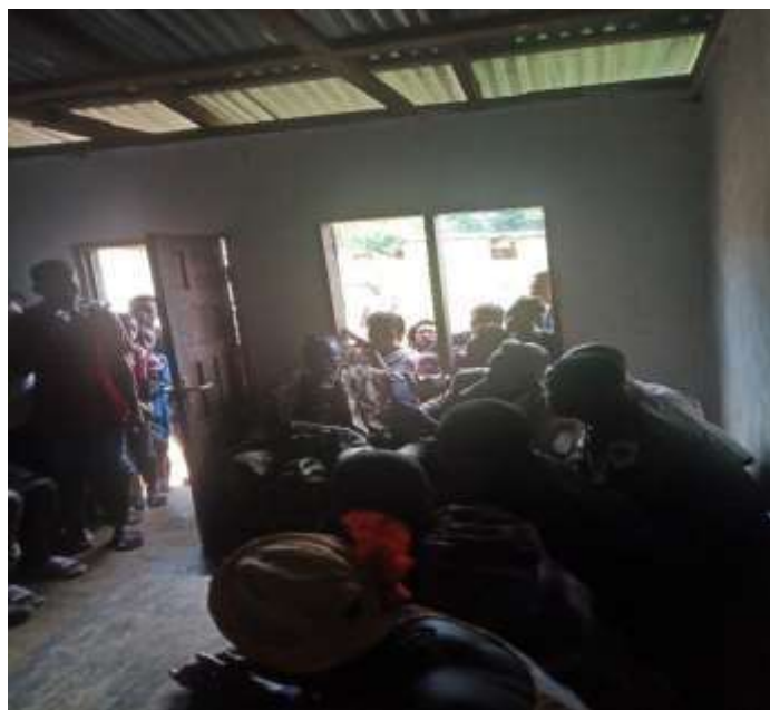
Séance de Sensibilisation sur les précautions et comportement à adopter pour la protection des Eléphants dans le village Wheplay (16/09/2020)