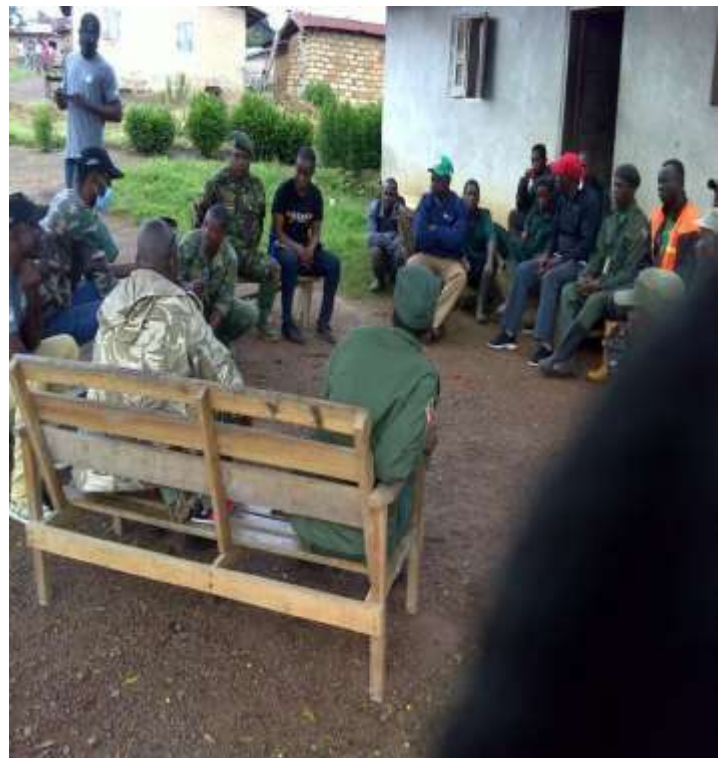
Formation des agents de FDA sur les techniques de suivi des éléphants (09/09/2020)