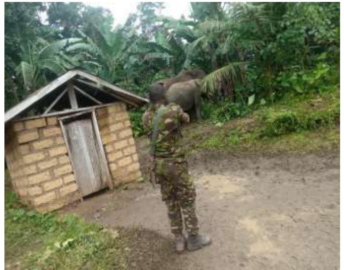
Présence des Eléphants dans le village Wheplay (17/09/2020)