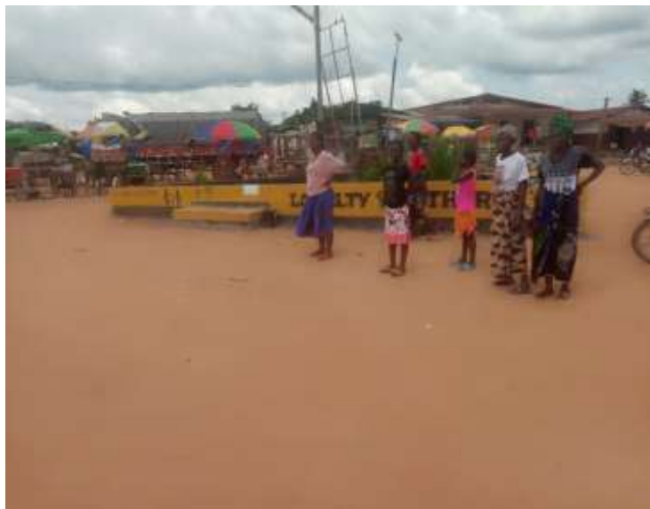
Séance de Sensibilisation sur les précautions et comportement à adopter pour la protection des Eléphants dans la préfecture de Bhan (15/09/2020)