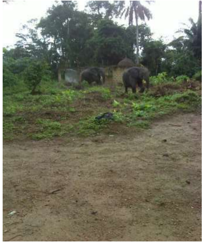
Village Gbéy-Lèpoula dans Sennielly (09 /09 /2020)