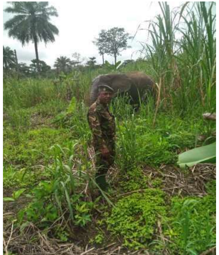
Première visite sur le terrain pour l'état des éléphants ( 09/09/2020)